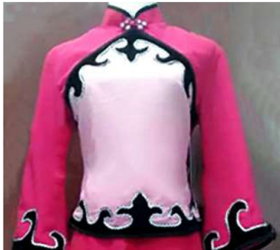
图片由笔者结合网络图片设计

沿淮花鼓灯服饰图案的创新设计,首先要打破固定模式,拓展新思维,找到旧有图案元素与现代设计的契合点,从中提取典型元素进行简化、添加、夸张或者重新组合,在保留原生态传统文化的同时,又不乏现代的形式美感,塑造出全新的花鼓灯服饰艺术形象。以女装花鼓灯服饰中的花卉图案为例。可以将具象的花设计为抽象的花,还可以增加蝴蝶等与之相呼应的抽象花卉,也可以将花卉从平面的设计成立体的,或将花从大的单独纹样变成小的二方连续、四方连续纹样,等等,摆脱传统图案设计的严格拘谨,使现代的花鼓灯服饰图案设计构成更加自由。其次,花鼓灯服饰图案的设计要追求简洁、协调、合体。 [3]