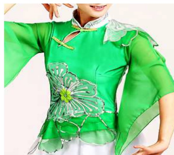
图片由笔者结合网络图片设计